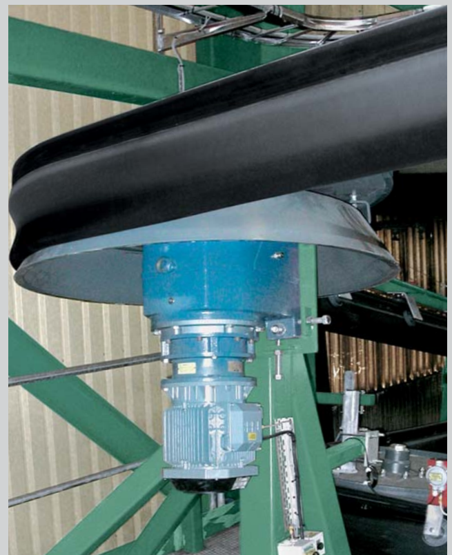
Buena adaptación a curvas sin puntos de entrega

La “bolsa” también permanece cerrada y libre de polvo en el ramal de retorno. De esta manera el material transportado está protegido y se evitan impactos ambientales. A lo largo del recorrido se pueden instalar varios puntos de carga y descarga.